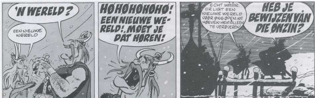
Asterix en de Grote Oversteek

De eerste mijlpaal werd bereikt in 1620 met de oprichting van de Plymouth Plantation. De Kroniek der Mensheid meldt hierover het volgende: 'Op 16 december heeft een groep dissidente Engelse puriteinen, de Pilgrim Fathers, die zich enkele weken geleden heeft ingescheept en koers gezet naar Amerika, voet aan wal gezet in het huidige New England, waar zij de kolonie New Plymouth heeft gesticht. De uitputtende tocht in het schip The Mayflower heeft aan één passagier het leven gekost. De grondslag van het bestuur van de ruim honderd zielen tellende nederzetting wordt gevormd door een verdrag, het Mayflower Compact , dat door eenenveertig mannelijke kolonisten is ondertekend. De Pilgrim Fathers vinden dat de Reformatie onvoldoende is doorgevoerd in de Engelse kerk. Zo zijn er naar hun mening nog te veel Roomse sporen achtergebleven in liturgie en reformatie. De groep vluchtte in 1608 naar Holland waar zij in eerste instantie de gewenste vrijheid van godsdienst vond. Na afloop van het Twaalfjarig Bestand (augustus 1621) kiezen zij mede door de dreiging van de Spaanse Inquisitie eieren voor hun geld en gaan het grote avontuur aan.' Het jaar 1620 wordt door muziekhistorici doorgaans beschouwd als het begin van de ontwikkeling van de Amerikaanse kunstmuziek. De reden is even simpel als banaal. De Pilgrim Fathers, goed calvinist als ze waren, geloofden dat het ongeleid zingen van