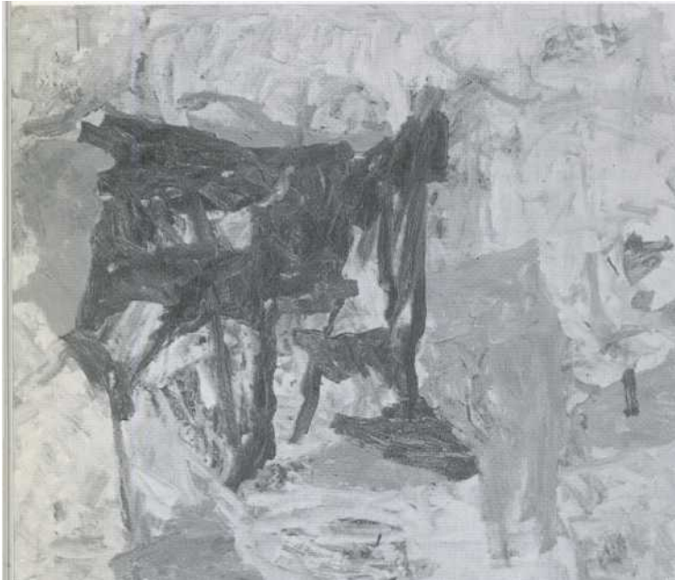
Philip Guston, Zonder titel (1958)

Niet alleen het Concertgebouw zal gedurende Ameri-