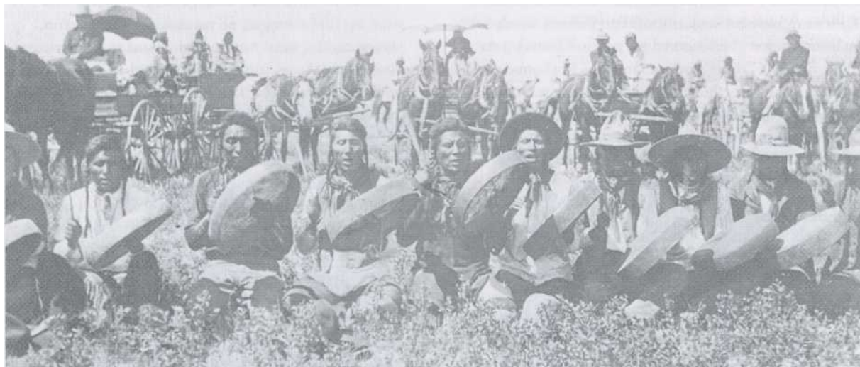
Raamtrommels bespeeld door Crow Indianen

De eerste Amerikaanse componist die ook buiten de Verenigde Staten bekendheid verwierf, was Louis Moreau Gottschalk (1829-1869). De door Chopin omschreven 'King of pianists' deed enkele min of meer geslaagde pogingen om de westerse romantiek te combineren met Afro-Amerikaanse invloeden. Bamboula (gebaseerd op Negro Songs), Ballade Créole en Chanson Nègre zijn enkele voorbeelden. Pas vijftig jaar later werd door Antonin Dvorak de draad weer opgepakt die Gottschalk had laten liggen. Dvorak verbleef gedurende driejaar (1892-1895) in New York, waar hij een uiterst zinvolle discussie op gang bracht over de identiteit van de Amerikaanse muziek. Dvorak betoonde zich een voorstander van het bewuste gebruik van typisch Amerikaanse elementen,